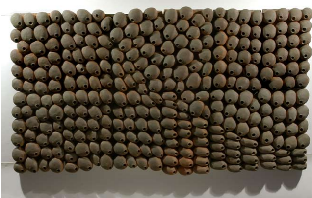
„Currents #2“.