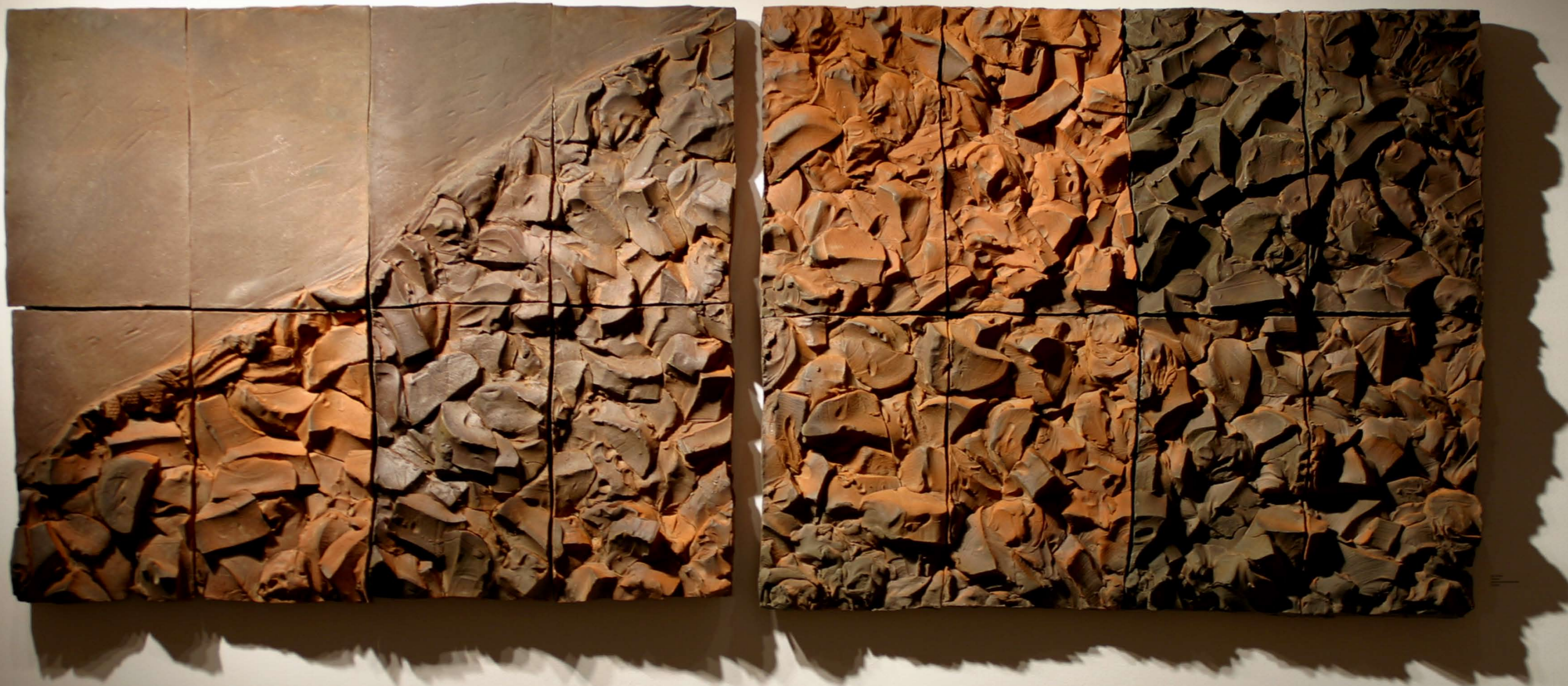
„tsunami“, Wandrelief von Joy Brown.

LIFESTYLE Münsterland besuchte im Sommer eine der erfolgreichsten und anerkanntesten amerikanischen Keramikünstlerinnen: Joy Brown aus Connecticut. Unser Exklusivbericht zeigt ihre Werke und gibt Einblicke in ihr außergewöhnliches Leben, ihr Schaffen und ihre Visionen.