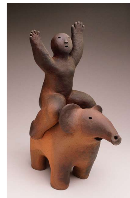
Fotos oben: Nancy Donskoj „recliner on side“ darunter „Riding Elephant“